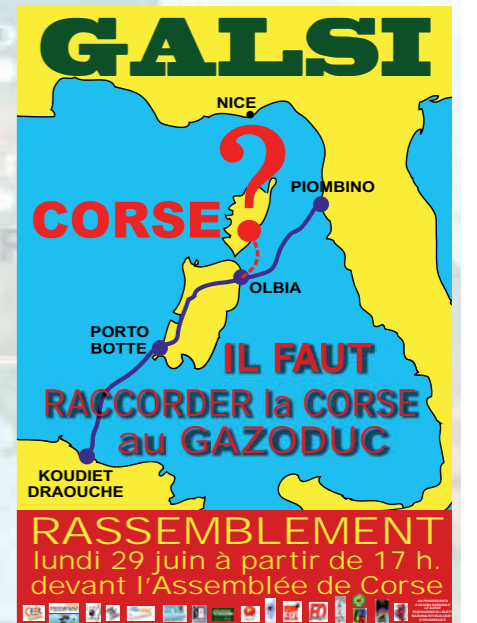
Affiche Roger Gossa

Le 29 juin, un rassemblement regroupait près de 25 associations devant l'Assemblée de Corse afin que celle-ci s'engage et vote une résolution