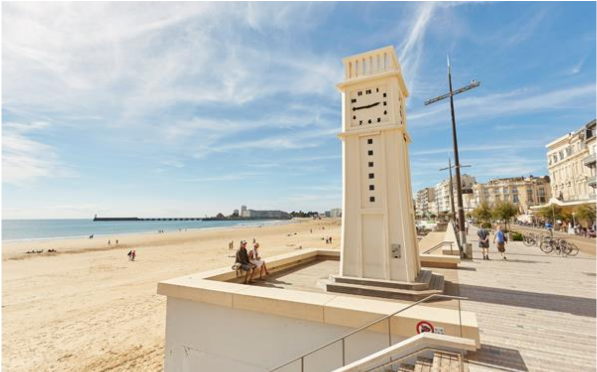
Le remblai actuel

Le projet fut confié au cabinet d'architectes Lancereau et Meyniel de Poitiers. Les travaux du Remblai entraînent dans le cadre du programme municipal « Les Sables 2010 » élaboré après une expertise des services touristiques de l'Etat, et concertation avec les forces vives de la ville.