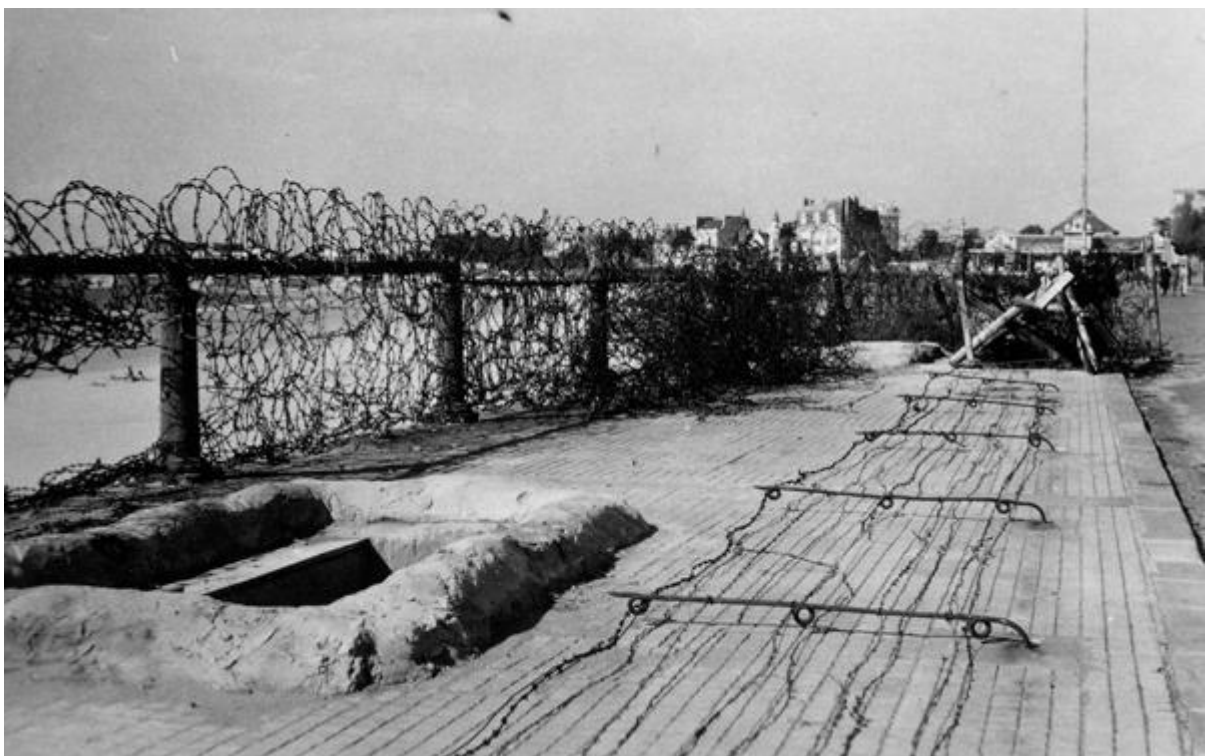
Le Mur de l'Atlantique vers 1944

Plus tard, lors de la seconde Guerre Mondiale , le Remblai fut intégré dans le système de défense du « Mur de l'Atlantique ». Des casemates parsemaient le remblai, des barbelés quadrillaient la chaussée et son accès était interdit.