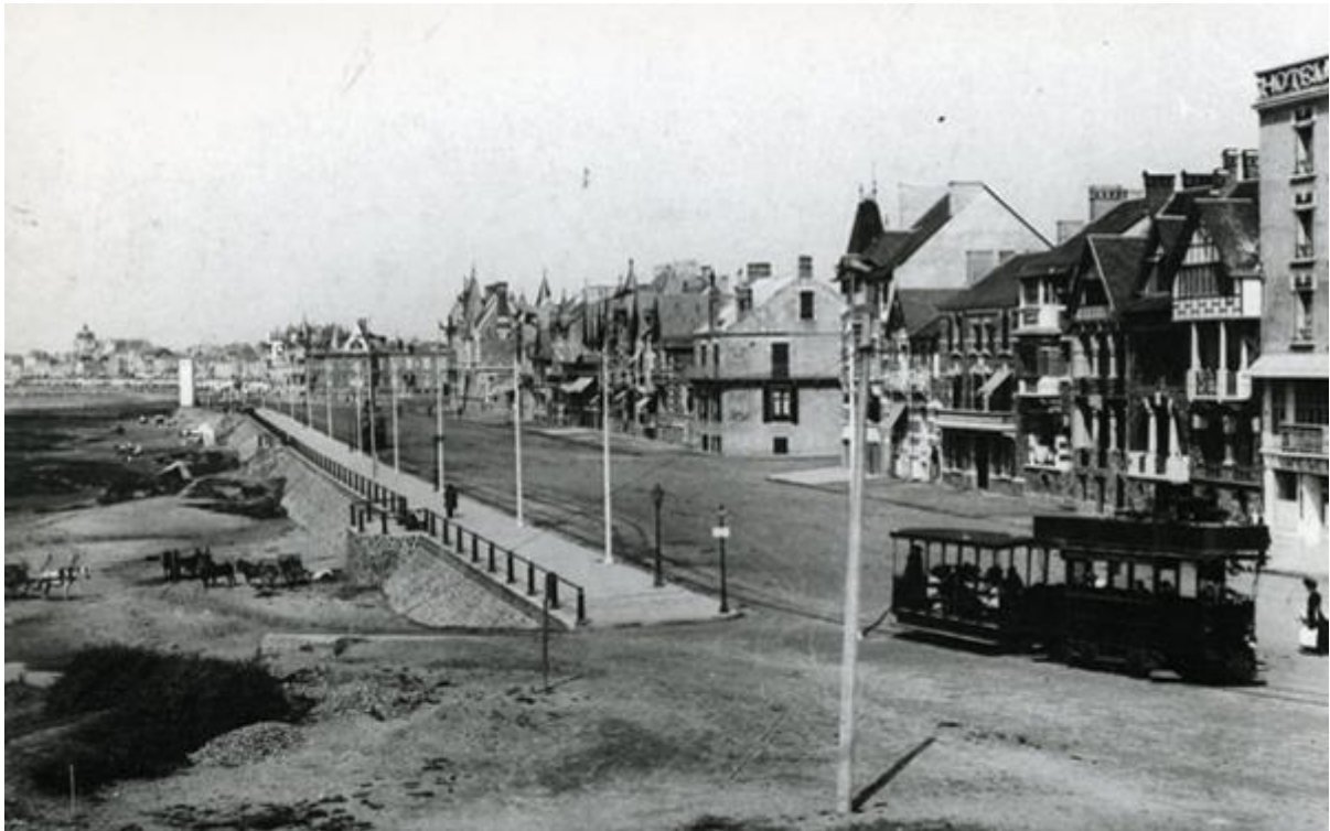
Le remblai vers 1910

Plus tard, lors de la seconde Guerre Mondiale , le Remblai fut intégré dans le système de défense du « Mur de l'Atlantique ». Des casemates parsemaient le remblai, des barbelés quadrillaient la chaussée et son accès était interdit.