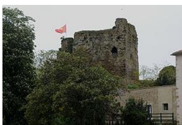
Château de Talmont-Saint-Hilaire.