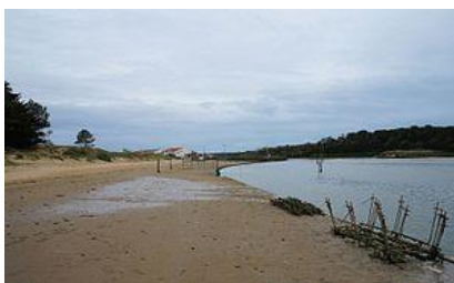
Le village d'ostréiculteurs de la Guittière.