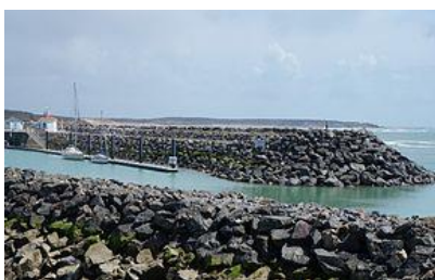
Port Bourgenay, l'entrée du chenal.