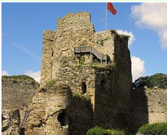
Le château de Talmont.